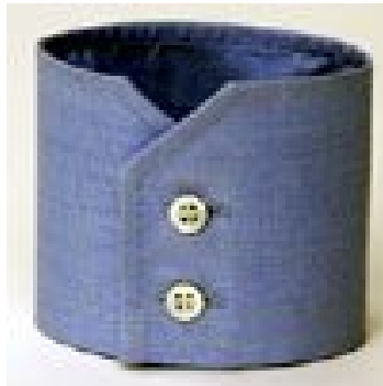
esagonale - 2 bottoni