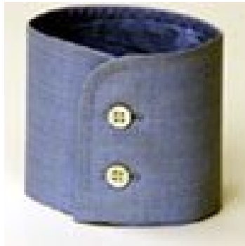
tondo - 2 bottoni