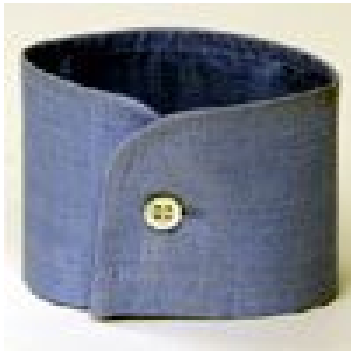
tondo - 1 bottone