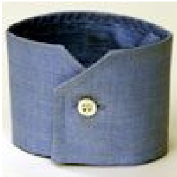
esagonale - 1 bottone